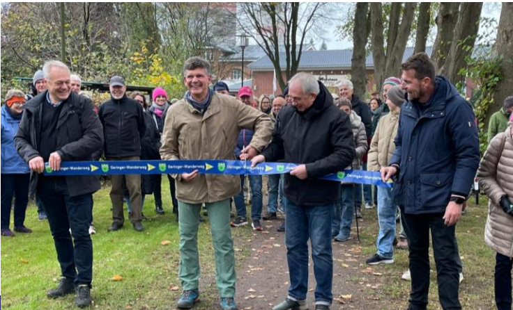
RBAL-24-11 Umsetzung der Wanderroute 22 in Oering

... im Alsterland leben ... das Alsterland erleben