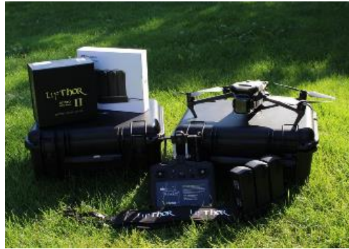
RBAL-24-20 Zwei zertifizierte Drohnen Kitzefinder Seth e. V.