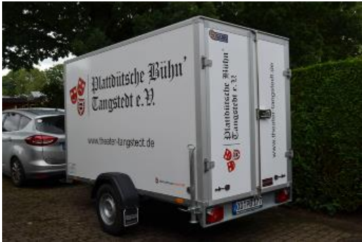
RBAL-24-03 Kofferranhänger 'Plattdütsche Bühn' Tangstedt e. V.